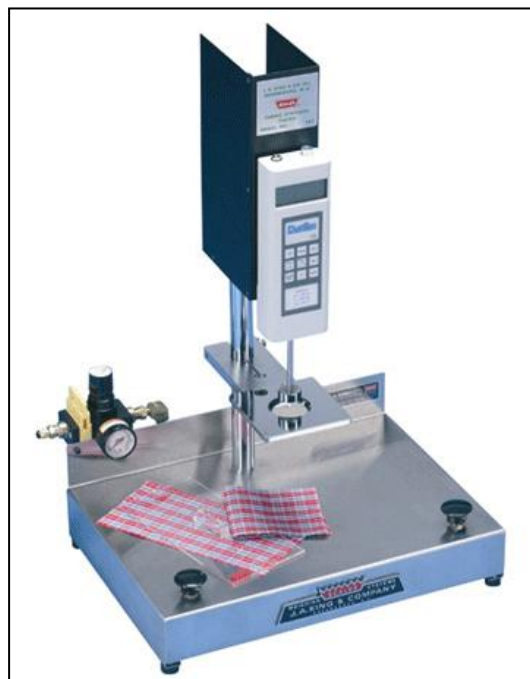
SASD-672 タイプ 自動測定方式（エアコンプレッサー使用） *コンプレッサーは別売りとなります。