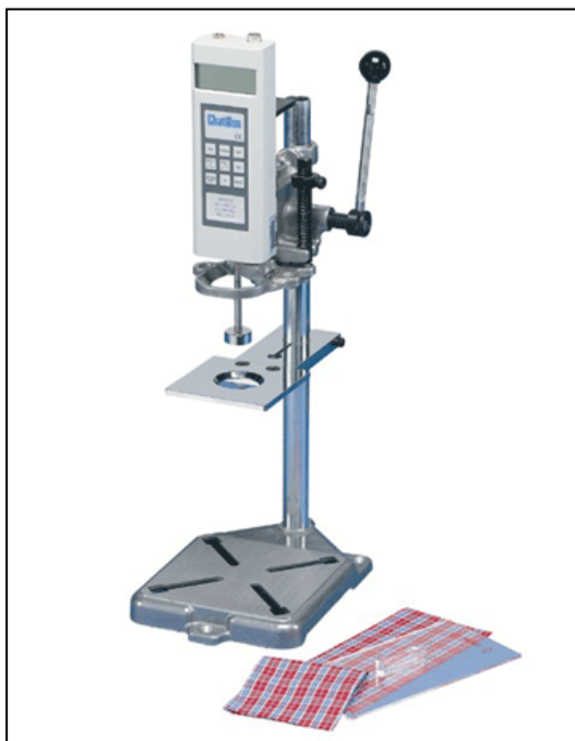
SASD-671 タイプ 手動測定方式